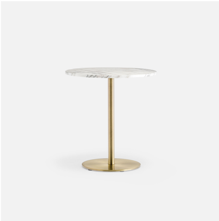
table nox 4401OA-1.jpg