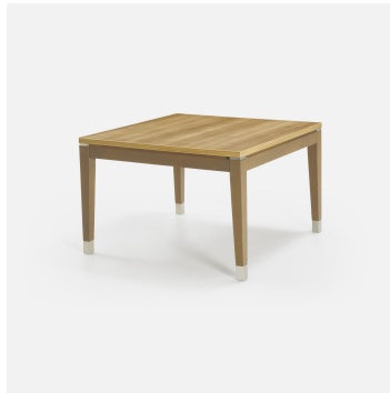
Table basse Réf. 1351